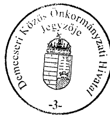
Balázné Keller Olga aljegyző