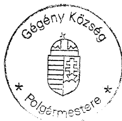
Zakor Ildikó polgármester