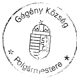
Zakor Ildikó polgármester