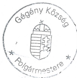
Zakor Ildikó polgármester